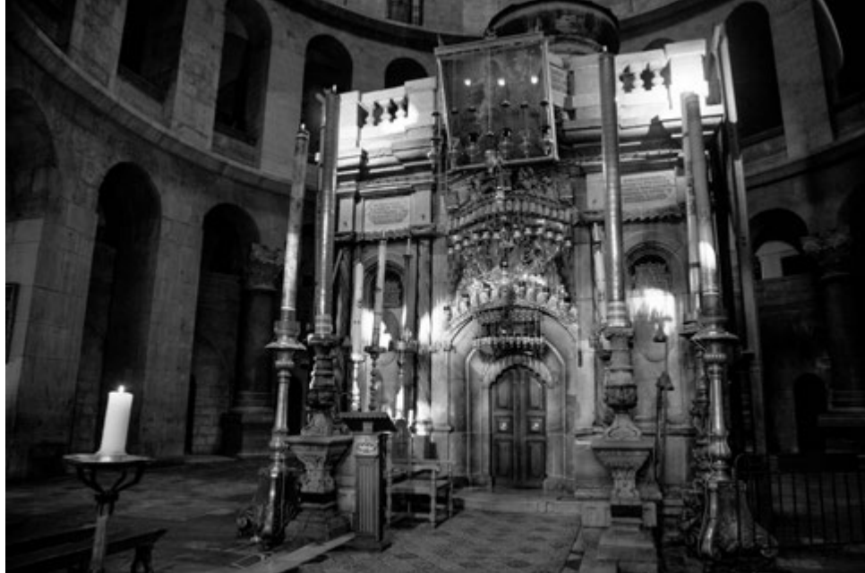
Lédicule — sanctuaire dont la tradition veut qu'il contienne à la fois le tombeau de Jésus et la pierre qui en boucha l'entrée — se trouve sous un dôme de l'Église du Saint-Sépulcre à Jérusalem.

donné et repris par Dieu dans la Torah et les prophètes. D'autres voient l'État d'aujourd'hui comme faisant partie de la promesse durable de la souveraineté juive dans le pays.