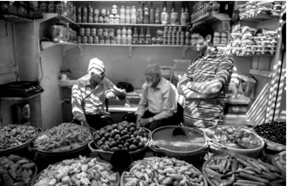
Des commerçants vendent des olives et des légumes marinés dans un marché de la ville d'Hébron.

Le MCC est présent depuis 1949. À l'origine, il s'occupait de répondre aux besoins physiques des réfugiés palestiniens issus de la guerre de 1948. Au fil des années, il a accepté l'invitation des Palestiniens à les accompagner dans leur quête de justice, de paix et de liberté. Le MCC travaille auprès de partenaires