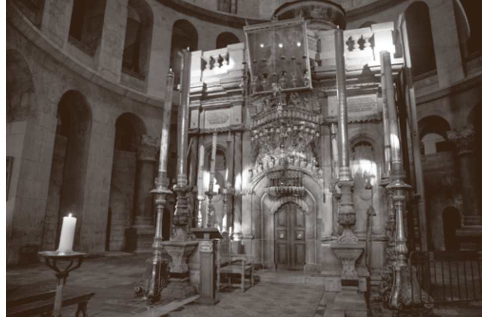
El edículo (una capilla que, de acuerdo con la tradición, contiene tanto la tumba de Jesús como la piedra que lo selló) se encuentra debajo de una cúpula de la iglesia del Santo Sepulcro en Jerusalén.