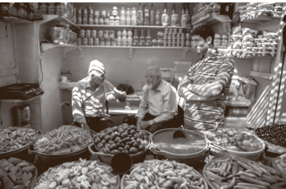
Vendedores venden vegetales y aceitunas en vinagre en un mercado en la ciudad de Hebrón.